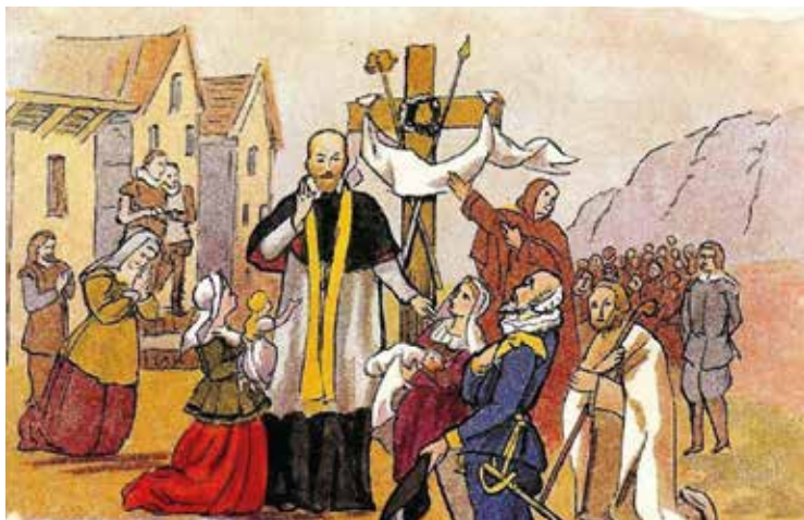
Franz von Sales, den Menschen in Liebe zugewandt und ein Lehrer und Vorbild im Gottvertrauen