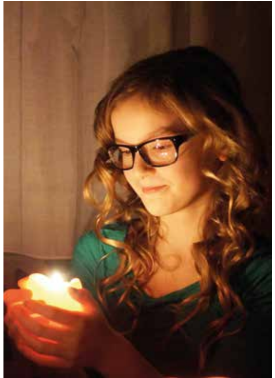
Schule muss ein Lernort sein, damit das Zarte, das Leise, das Mitmenschliche wieder eine Chance hat

Der Gebildete, der der sich ein Bild vom Leben malen kann, ist kein billiger Egoist, ist kein verängstigter Neinsager, ist kein Leugner von Realitäten, sondern sieht das DU, sieht die Not des andern und hungert nach Frieden, den unsere Welt so sehr braucht. Das Leben ist kein