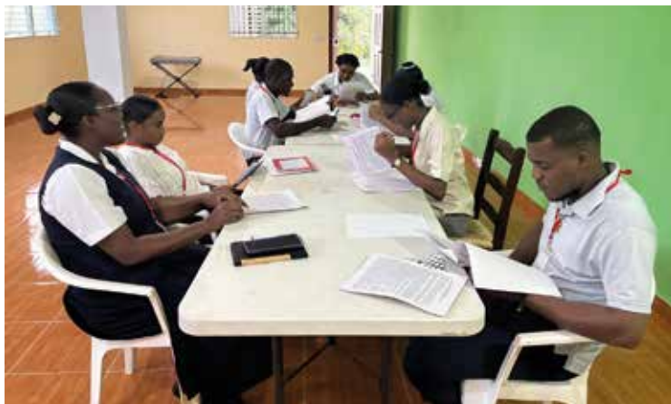
Eifriges gemeinsames Lernen der Schüler/innen mit ihren Lehrerinnen

Wir bieten verschiedene Aktivitäten für Jugendliche an, doch finanzielle Schwierigkeiten verhindern, dass wir die notwendigen Lehr- und Lernmaterialien für deren Durchführung beschaffen können. Die Jugendlichen, die an den Workshops zur Sandalenherstellung teilnehmen, benötigen Material für den Einstieg. Die