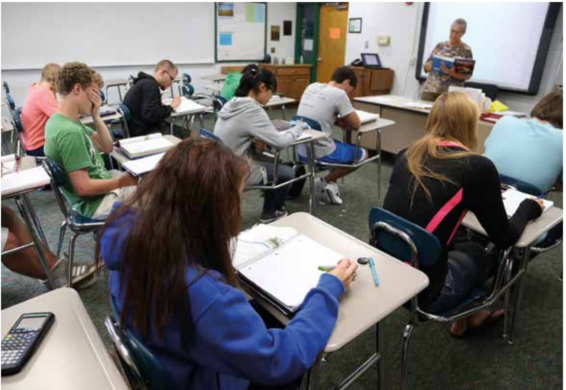
Maxime einer guten Schulbildung: Es geht immer um den Menschen, nie um die Sache

Als ich ihre Gedanken hörte, dachte ich, da ist vieles gelungen. Und es ist all die Jahre unseres Gymnasiums mit knapp 900 Schüler:innen und 100 Lehrer:innen unser großes Bildungscredo: „Es geht immer um den Menschen, nie um die Sache.“ Es geht um den ganzen Menschen, der im „Shalom“ (wörtlich: „unzerstückelt“) leben möchte.