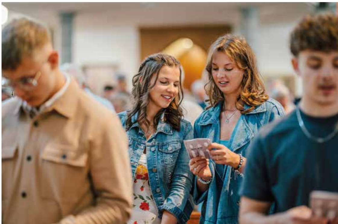
Leben braucht Orientierung an einem festen Ausgangspunkt und einen für Entscheidungen offenen Raum

Denn Leben, Lernen und Sich-Entwickeln sind Grundvollzüge des Menschseins. Was ich bin, bin ich nicht von Anfang an; ich werde es im Laufe der Zeit. Dieses Werden verlangt, dass ich über mich selbst hinausgehe und mich der Welt und vor allem den Mitmenschen zuwen-