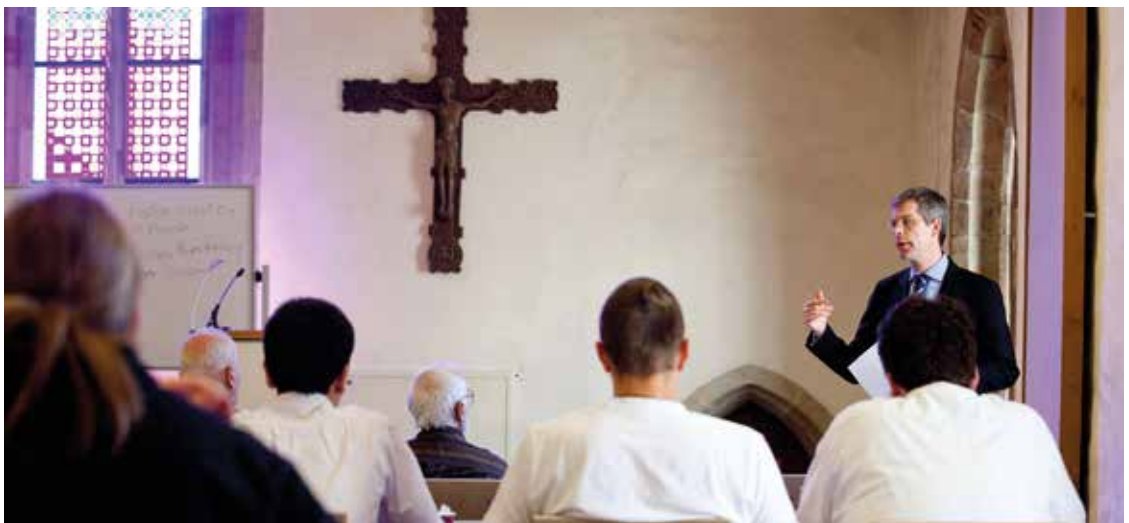
Hören der Vorlesungen: Hauptgerüst auch des Theologiestudiums (Bild: Sandro Joedicke, In: Pfarrbriefservice.de)

Und noch immer bilden etwa Vorlesungen an den Universitäten das Hauptgerüst des Studiums. Freilich müssen die Studenten auch mitschreiben