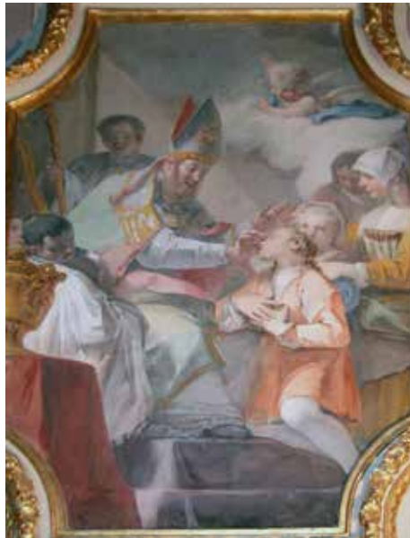
Dem heiligen Franz von Sales war die religiöse Bildung ein besonderes Anliegen. Hier spendet er die Firmung. (Gemälde aus dem Heimsuchungskloster von Pinerolo, Italien)

Dass sich Franz von Sales bei dieser Arbeit selbst sehr wohlfühlte, lesen wir in einem anderen Brief an Johanna Franziska von Chantal: „Was soll ich Ihnen nun sagen? Ich komme gerade vom Katechismusunter-