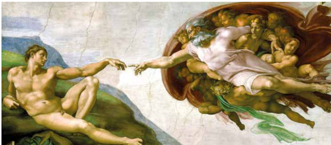
Gott schafft den Menschen als sein Ab-Bild und gibt ihm so einen festen Bezugspunkt: Die Erschaffung Adams von Michelangelo aus der Sixtinischen Kapelle, Vatikan

de. Dieser aktive Prozess braucht beides: einen festen Ausgangspunkt, der Halt und Orientierung gibt, und einen offenen Raum, in dem Freiheit, Entscheidung und Verantwortung möglich sind. Diese Freiheit und Offenheit setzen ein positives Selbst- und Menschenbild voraus. Ein Menschenbild, für das auch Franz von Sales eingetreten ist.