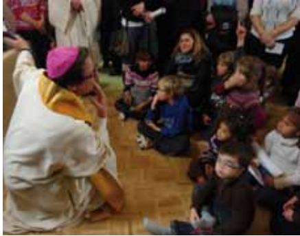
Bei der Einweihung der Krippe bezog Bischof Felix Gmür auch die Kinder ein.

S oyhières, das kleine Dorf im Schweizer Jura, ist nicht nur der Geburtsort der Heimsuchungsschwester Marie de Sales Chappuis, die den seligen Louis Brisson dazu bewegte, die Oblaten des heiligen Franz von Sales zu gründen. In diesem Ort wirkte auch die heilige