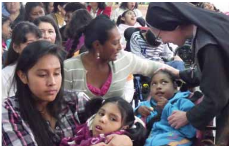
Gerade in der Weihnachtszeit geben die Schwestern die Liebe und Zuwendung Gottes an die Menschen weiter.

beginnt man schon neun Tage vor dem Weihnachtsfest zu feiern, und diese Weihnachtsstimmung konnte auch der normale Schulalltag nicht verdrängen. Die Weihnachtsnovene, diese neun Tage des betenden, singenden und feiernden Vorbereitens auf Weihnachten, ist Ausdruck einer gewissen Abgeklärtheit, vor allem aber des Vertrauens der Menschen in Gott, des tiefen Wissens, dass man sich den Sinn des Lebens nicht selbst schaffen kann und muss, und der Freude darüber, dass Gott mit seiner Liebe jedem entgegenkommt im kleinen Kind von Betlehem und ihn so annimmt wie er ist.