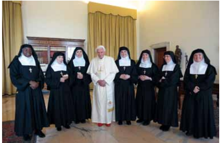
Papst Benedikt XVI. mit den Heimsuchungsschwestern von „Mater Ecclesiae“

darin, dass die Heimsuchungsschwestern 2010 ihr 400jähriges Jubiläum feierten.