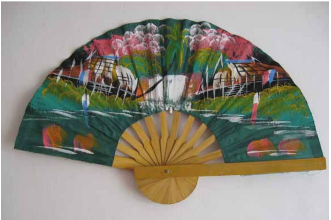
Das Leben erscheint einem manchmal wie ein Fächer: auf den ersten Blick wie das schwarze Gerippe, doch auf den zweiten wird es richtig bunt.

Anhand dieser beiden Bilder wurde mir allerdings auch bewusst, dass eine Entscheidung von mir gefordert ist. Die spontane Gefahr lag darin, den Bildern zu unterstellen, sie seien ja eh nur billiges Gerede und hätten nichts mit der Wirklichkeit zu tun. Ich musste mich dafür entscheiden, meinen Blick zu erweitern. Mich dem Leben – und damit Gott zuzuwenden. Immer neu erkannte ich, dass der „Fächer in seiner Gesamtheit“ die Wirklichkeit ist. Weder das Gerippe, noch der bunte Stoff dazwischen sind jeweils alleine die Wirklichkeit. Und im Bild der Küchenschelle: Auch nach dem härtesten