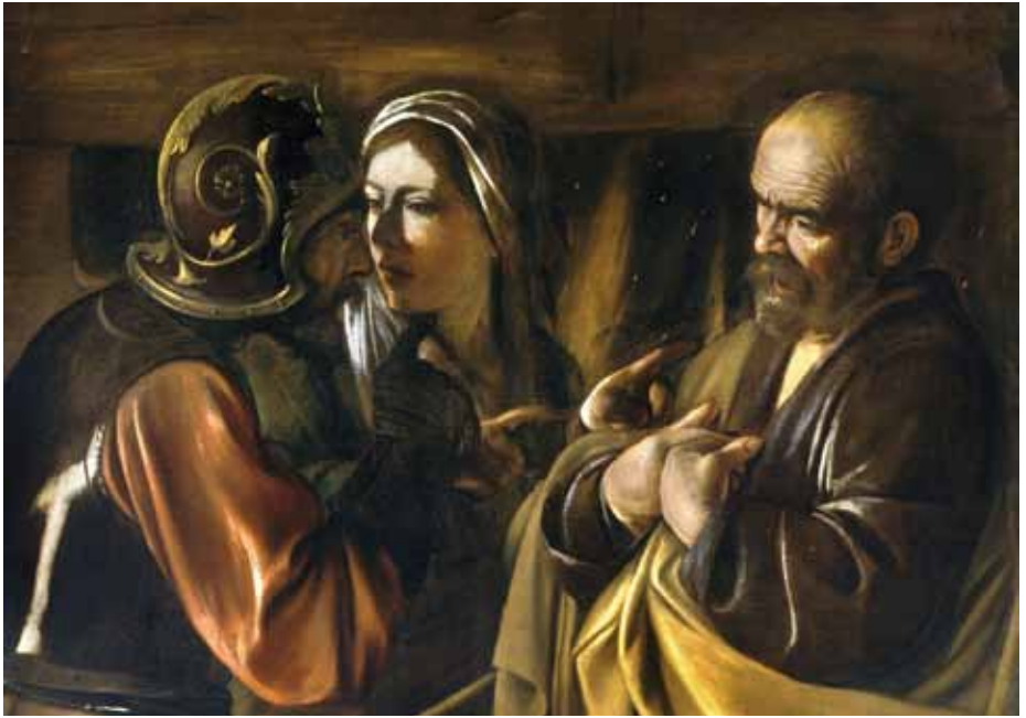
Auch der reuige Petrus, der ihn verleugnet hatte, blieb für Christus wertvoll. (Verleugnung durch Petrus, Gemälde von Michelangelo Merisi da Caravaggio aus dem Jahr 1610)

Herzen Jesu etwa weniger teuer? Und von den beiden Schwestern, die im Hause des Lazarus wohnten, welche liebte Jesus mehr? War es nicht die, der er mehr verziehen hatte? Mut also selbst nach einem Fall, Mut, damit wir Gott ein reuiges Herz zurückbringen, das in seiner früheren guten Gesinnung erneuert wurde.