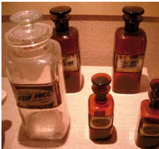
Gibt es Medikamente für die Hoffnung?

Apothekerin: Auch ich bedanke mich. Es kam noch nie jemand in unsere Apotheke mit so einer „Krankheit!“