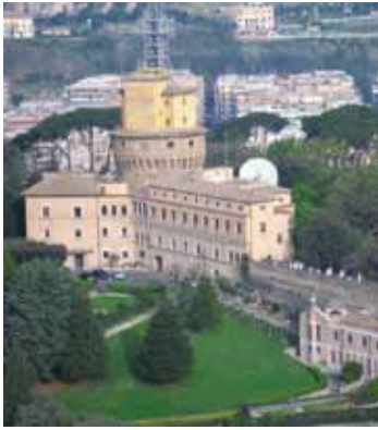
Das Kloster im Vatikan

R und drei Jahre lang waren Schwestern der Heimsuchung im Kloster „Mater Ecclesiae“ im Vatikan, jetzt haben die sieben Ordensfrauen das Kloster am 22. Oktober 2012 wieder verlassen und sind in ihre Heimatkonvente zurückgekehrt.