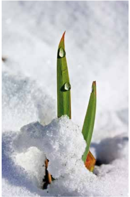
Nach dem Winter beginnt der Frühling erst ganz zart.

Oder es spürt jemand, dass das Festhalten an der Resignation nicht weiterbringt und dass es sich lohnt, für eine Idee zu kämpfen. Vielleicht gelingt es sogar Mitstreiter zu gewinnen.