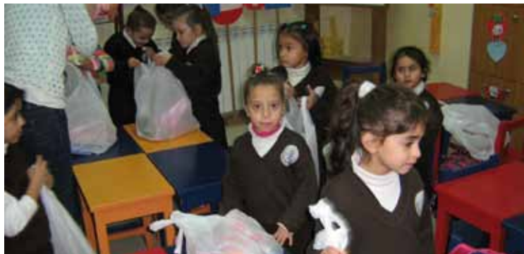
Unsere Kleinsten freuten sich über die Weihnachtsgeschenke

Vielen Dank auch für die zwei Exemplare jeder LICHT-Ausgabe, die Sie mir in der Zeit geschickt haben, in der unser Projekt vorgestellt wurde.