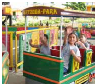
Viel Spaß bei einem Ausflug

ler interessanter Dinge für die Mädchen. Wir zeigten ihnen eine Fabrik, wo Seife und Plastiktüten hergestellt werden. Sie genossen den Tag und haben viel gelernt. Im Sommer kauften wir einen Teil der angeforderten Bücher für das neue Schuljahr und konnten einiges von dem wirklichen, was wir in unseren früheren Texten vorgeschlagen hatten. Wir reparierten Türen, Stühle, Tische, lackierten die Tafeln sowie die Schutzgitter an allen Treppen im Schulbereich. Ebenfalls errichteten wir das Dach für den kleinen Hof unseres Kindergartens mit dem speziellen Material, das das Ministerium für Bildung verlangt, da unsere Pläne für eine Kunststoffüberdachung nicht befürwortet wurden.