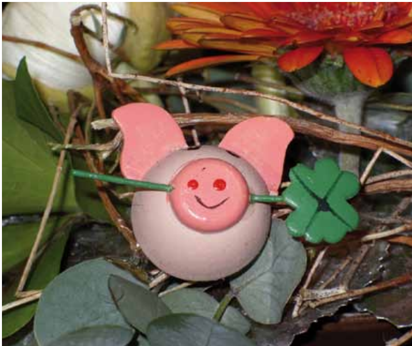
Ein Schweinskopf an Silvester eröffnete neue Perspektiven

Ich stehe am 31. Dezember bei meinem Metzger, um den bestellten Schweinskopf für den Neujahrstag abzuholen. Die Weihnachtszeit hat ihm sichtlich zugesetzt. Die vielen lästigen Kunden, tausend Dinge zu erledigen, Bestellungen hier, Bestellungen dort. Immer zu spät ins Bett und nach Feierabend zu tief ins Glas