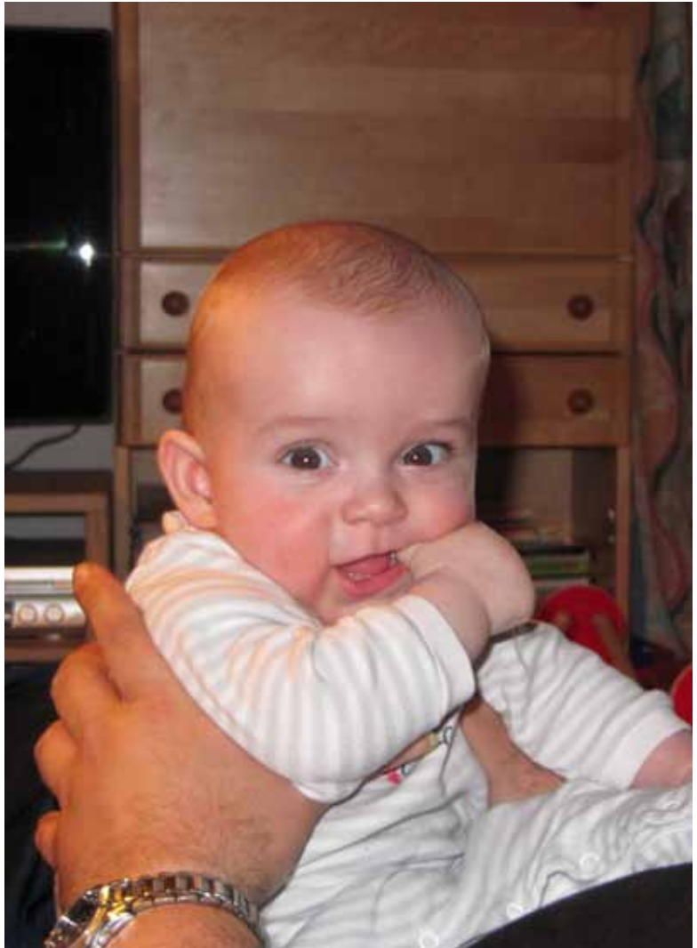
Kinder sind und bleiben in Gottes Hand

Der Glaube gab vielen Herzen den verlorenen Frieden wieder zurück und Hoffnung über den Tod hinaus, während Unglaube und Tod allen Sinn, alle Hoffnung auslöschen. Zu viele hatte die Guillotine geköpft, Krieg und Tod hatten gewütet. Aber die herrlichen Kirchen als Mahnmale waren nicht umzuwerfen – der Glaube im Volk nicht auszulöschen. Der christliche Glaube bringt die Hoffnung auf ewiges Leben wieder. Kreuz und Auferstehung Christi