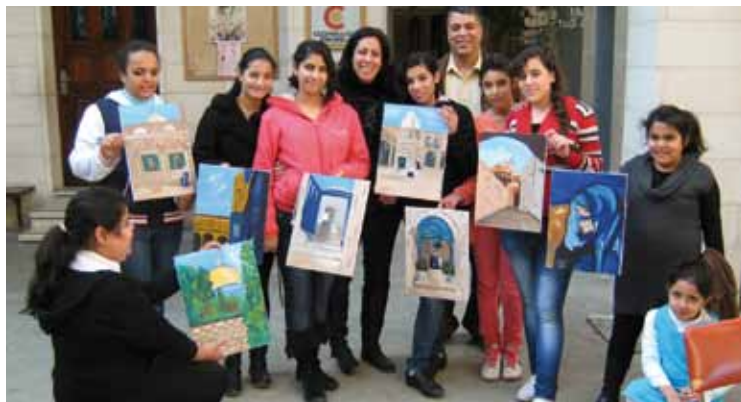
Die Schülerinnen beim Malkurs