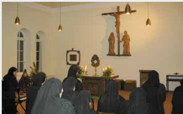
Eucharistische Anbetung vor der Monstranz des Kongresses

„Wohin sollen wir gehen, Herr? (Joh 6,68). Unter diesem Thema steht der Nationale Eucharistische Kongress 2013, der vom 5. bis 9. Juni in Köln stattfinden wird. Zur Vorbereitung auf dieses Ereignis des Glaubens befindet sich die Monstranz vom Eucharistischen Weltkongress 1960 in München seit dem Ersten Advent 2012 auf einer Reise durch alle deutschen Diözesen. Dies soll ein Zeichen der Verbundenheit zwischen den einzelnen Bistümern und deren Gläubigen sein. Vom 12. bis 18. Januar 2013 wurde sie