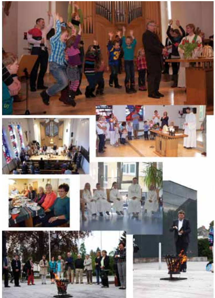
Buntes kirchliches Leben in der Konviktgemeinde Ried

meinde und bietet als Kraftquelle auch weiterhin den Raum für neue Wege.