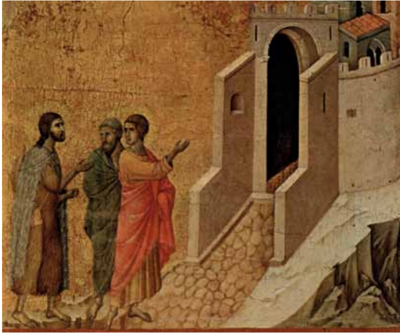
Die Emmausjünger: Brannte uns nicht das Herz in der Seele, als Er mit uns redete? (Gemälde von Duccio di Buoninsegna)

Bei Exerzitien für Ordensschwestern habe ich in den letzten Jahren Ähnliches erlebt. Wie viel Angst vor dem Auge, das alles sieht, steckt noch in den Knochen dieser Schwestern, die sich doch auf den Weg der Nachfolge gemacht