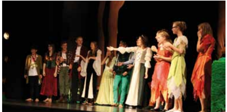
Die Schauspieler genießen den Schlussapplaus

Dachsberger Schultheater frei nach Shakespeare