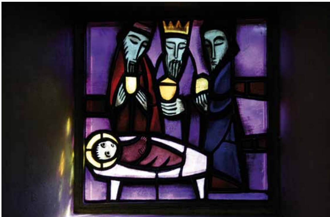
Glasfenster „Epiphanie“ von Frère Eric des Saussure, Versöhnungskirche Taizé

Armen Seelen in den Himmel eingehen dürfen. Weil dieses lieblichste Hochfest des Kirchenjahres die Herzen mitnimmt zu Gott. Sogar die Bösen sind in dieser Zeit besser als sonst.