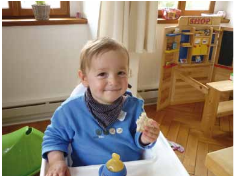
„Sich über kleine Dinge freuen“

viele. Gerade in meinen Kursen, die ich gebe, sitzen viele Schüler und Studenten am Anfang gelangweilt in den Bänken. Doch ich versuche sie zu begeistern. Meine Frau sagt selbst: Du solltest einmal den Steuerkodex im Kinderzimmer liegen lassen. Die Kinder werden sofort einschlafen, so langweilig wie das ist. Ich gebe zu, es ist trocken, sehr trocken. Doch gerade hier sehe ich eine interessante Spannung: Ich brenne förmlich für dieses Thema. Wenn ich im Urlaub bin, schau