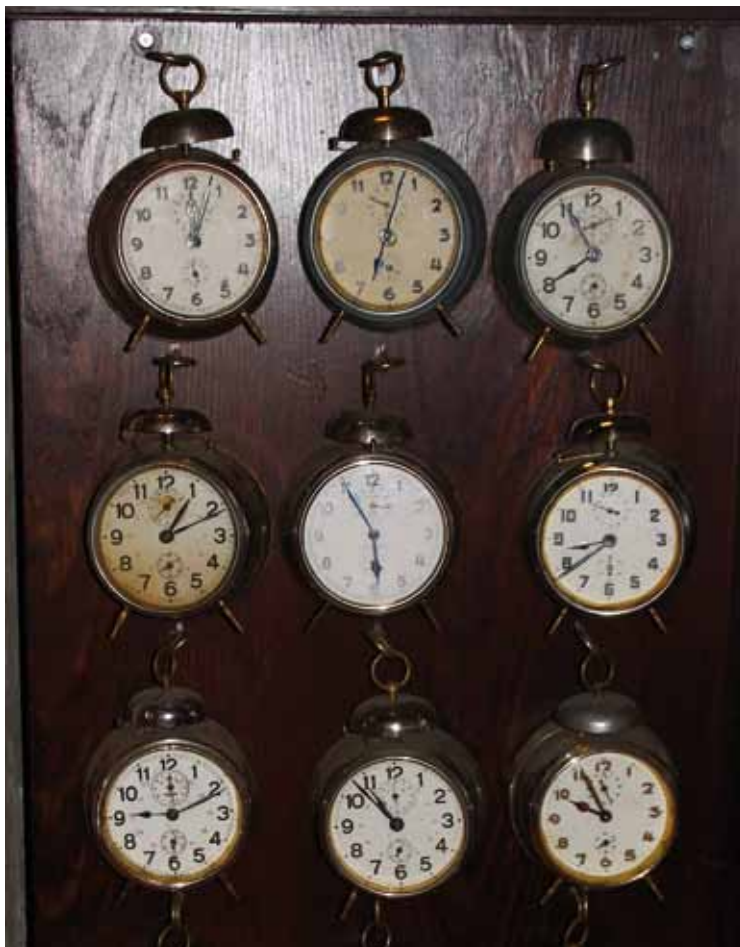
Schenken Sie irgendjemandem fünf Minuten Ihrer Zeit!

An diesem Tage hatte ich zwei Freude-schenken-Erlebnisse: