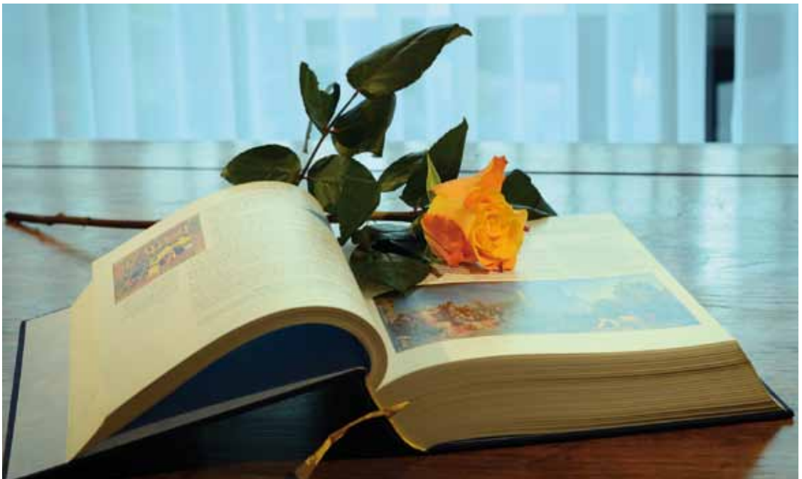
Das Evangelium: ein Buch über die Liebe, Vergebung und gegenseitige Wertschätzung

Auch der Koran fand reißenden Absatz; keine Rede von der medialen Gefahr oder gar Angst war zu spüren, die einschlägige fanatische