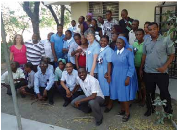
Das Team in Haiti

Ärztin Dr. Zilda Arns gegründet. Sie ist eine Liebesgeschichte, ganz im Sinn des heiligen Franz von Sales, der sagte: „Die Geschichte der Menschheit zeigt sich als Liebesgeschichte, und die Aufgabe, die Berufung, eines jeden ist, auf diese Liebe zu antworten“.