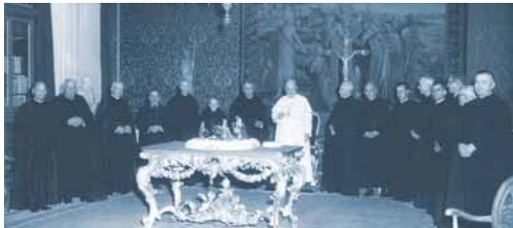
Das Generalkapitel der Sales-Oblaten 1961 bei der Privataudienz beim heiligen Papst Johannes XXIII.

Gut, dass wir bei diesen Fragen schon einige Übung haben. Auf diese Weise können wir nämlich eine Antwort geben: Salesianisch leben heißt so leben, dass die Menschen, denen wir begegnen, spüren können, dass Gott ein Gott der Liebe ist, durch Demut und Geduld,