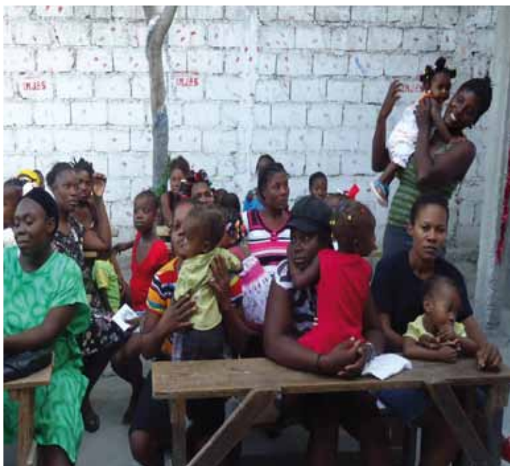
Hilfe für Mütter und Kinder

Die Kinderpastoral hat das Ziel, einen wichtigen Beitrag für die Entwicklung der Menschen und besonders der Kinder zu leisten, von der Schwangerschaft an und unabhängig von der Nationalität, Hautfarbe, Religion und Geschlecht, denn unser Ziel ist