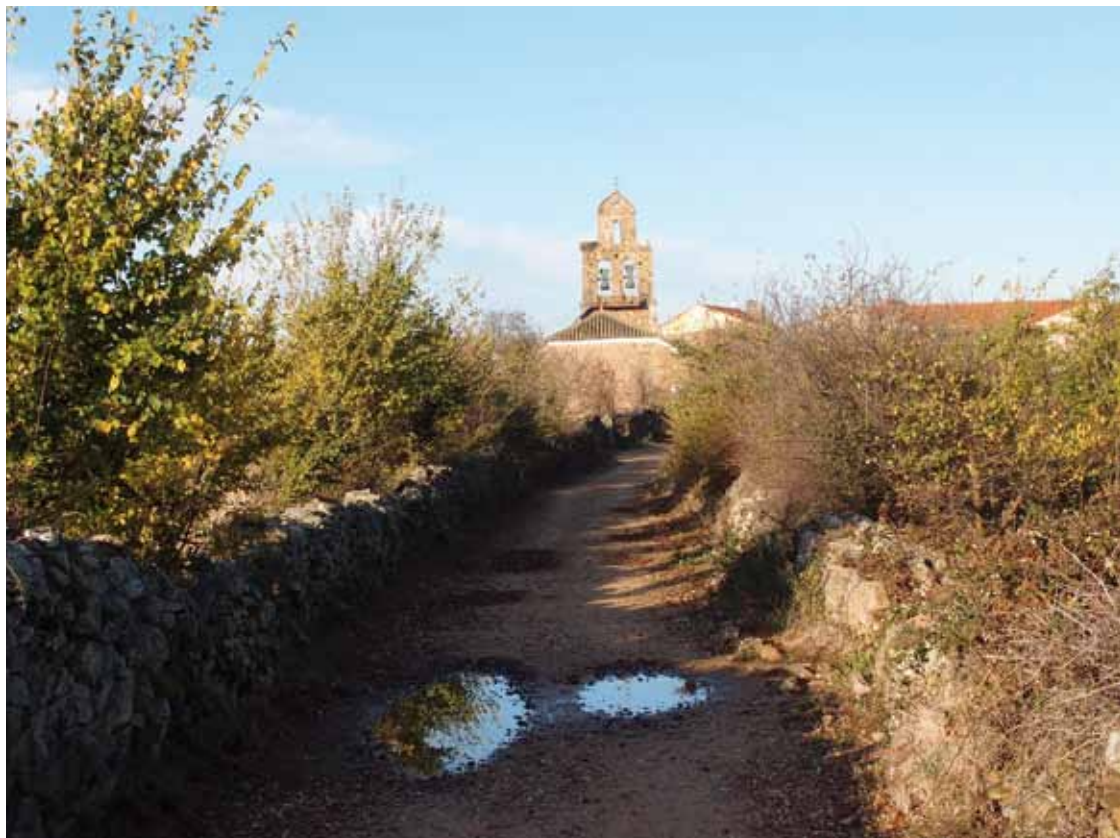
Entdeckung von Glaube, Hoffnung und Liebe in Gott

Geist, eine lodernde Flamme in und über den Köpfen der Jünger und uns Menschen. Der Geist entfacht das Feuer der Liebe. Eigentlich wunderbar, wie die ersten drei Gesätze im Rosenkranz formuliert sind, fast genial: